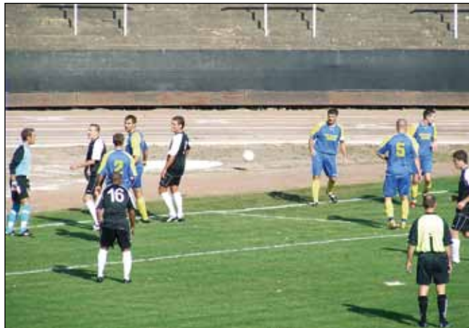
A Maglód elleni döntetlen után most a győzelem a cél