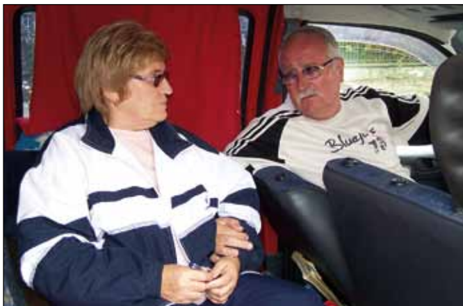
A férj úgy döntött, átveszi felesége helyét

Megkeresésünkre kiadott egy közleményt, amit annyival egészített ki, hogy több százmillió forint kintlévőségük van olyan cégeknél, ahol korábban alvállalkozóként dolgoztak. Egy évvel ezelőtt még 150 főt foglalkoztattak, most viszont húsz dolgozójuknak sem tudnak munkát szerezni, de bíznak abban, hogy megoldódik a helyzetük és akkor ki tudják egyenlíteni a követeléseket.