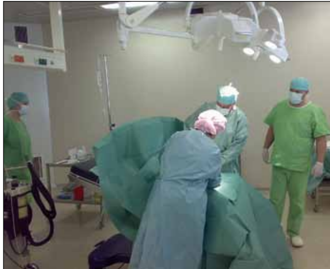
Az ezredfordulóra európai színvonalú kórháza lett a városnak

1956-ban közel 7,5 millió forint költséggel elkezdtek a kórház előtt lévő területen a korszerű szakorvosi rendelő építését. A szakrendelő épülete 1959-re elkészült, és 1960. április 3-án adták át, 17 munkahellyel. Az országban elsők között valósították meg a kórház-rendelőintézet egységet, melynek szervezeti formáját akkor a legkorszerűbbnek tartották.