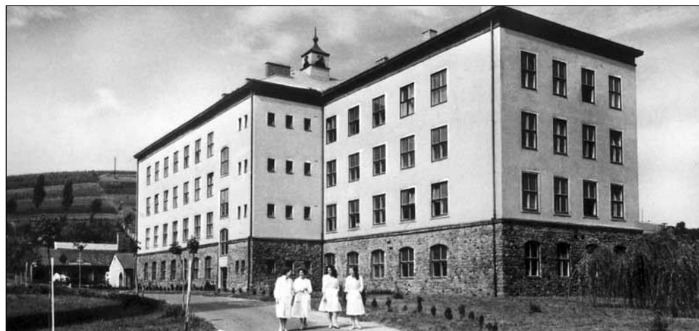
Az ózdi kórház – egy évvel az átadás után

A betegellátó osztályok (szülészet, sebészet, belosztály, gyermekosztály) a háromemeletes épületrészben kerültek elhelyezésre. A nyugati szárny, az úgynevezett apáca-lak a hozzá épített kápolnával a rendi ápolók lakhelyéül szolgált. A kórházat 150 ágyásra tervez-