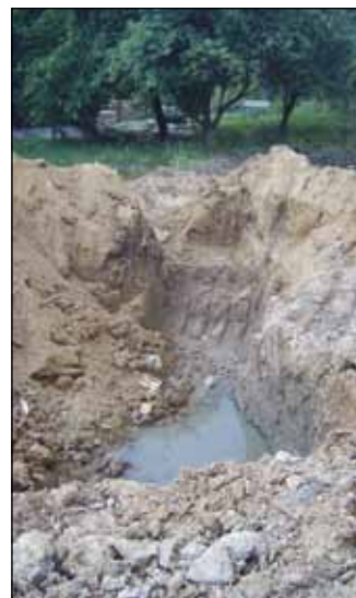
Nyitva az emésztő

A terület rendezése törvény szerint a tulajdonos kötelessége, ám jelen esetben annak kiléte is talány, ezért nagyon úgy tűnik, hogy a sok bába között elveszett a gyerek. Az eredeti tulajdonos – aki egykor saját maga építette a házat – felajánlotta a bontásra váró családi fészket az önkormányzatnak. Ez volt ugyanis a kárenyhítés feltétele, így nemcsak a martinsalakos háztól, hanem a környéktől is búcsúzott. Az ingatlanról – és vele együtt a bontásról – a város is lemondott, ráhagyva a területet az államra. Mindez 2007 áprilisában volt,