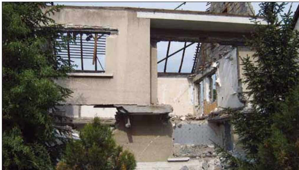
Az életveszélyes épületet az illegális bontók még veszélyesebbé tették

Nemcsak esztétikai gondot okoz a terület elhanyagoltsága, a bűz is elviselhetetlen, különösen nyári napokon. Kistóban nem ez az egyetlen salakos ház maradék, a többi lebontott épülettől az különbözteti meg, hogy míg azok romosan, törmelékesen hirdetik egykori nagyságukat, a Tinódi 34. helyén mély gödrök maradtak. És minden jel arra utal, hogy még maradnak is.